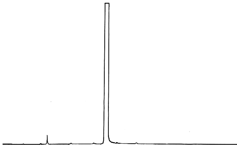
图 B.1 食品添加剂丁酸苄酯气相色谱图